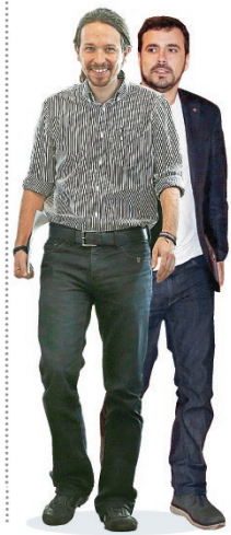
Pablo Iglesias Alberto Garzón